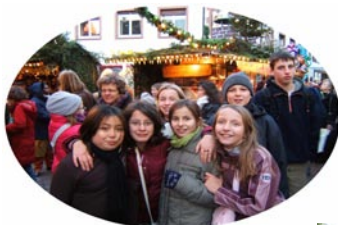
Marché de Noël à Fribourg (Traditions allemandes)