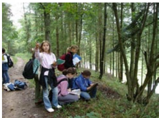
Découverte du Sentier Botanique de la Forge